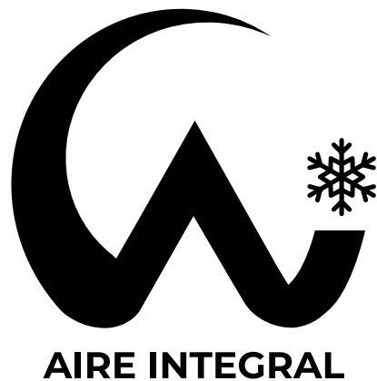
Versión blanco y negro