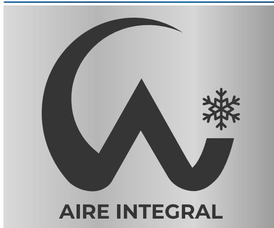
Versión con fondo